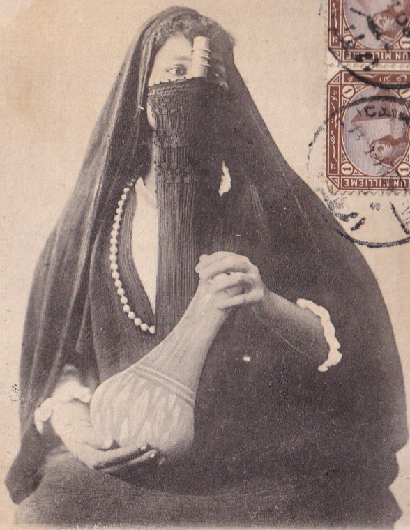
Jeune fille Arabe